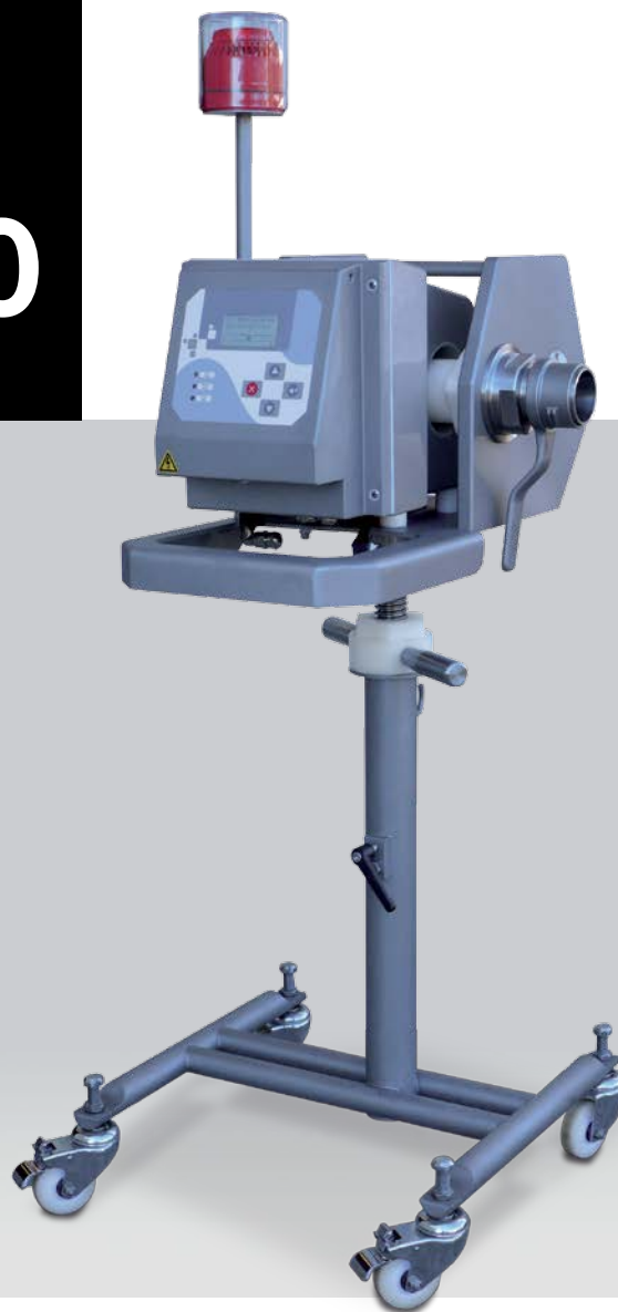
Imagen de MDS-5500