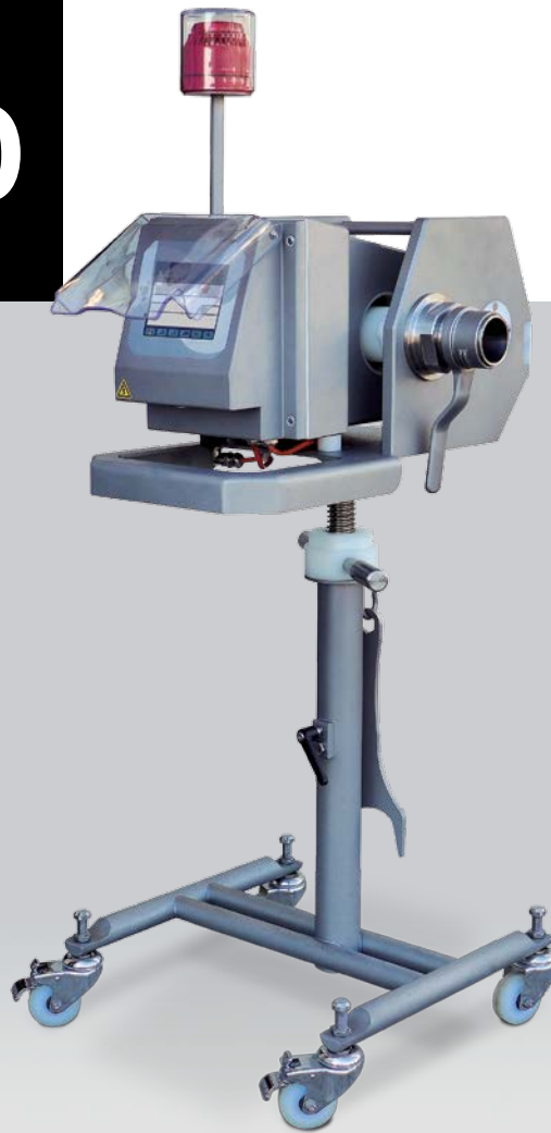
Imagen de MDS-5700 con tapa de protección opcional